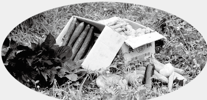
夏は 畑とその収穫 (紫蘇、キュウリ、カボチャ、ナス、ジャガイモ、ニンジン)