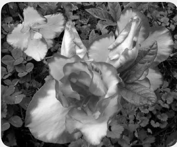
斑入りのサツキ (庭木の種類も豊富)