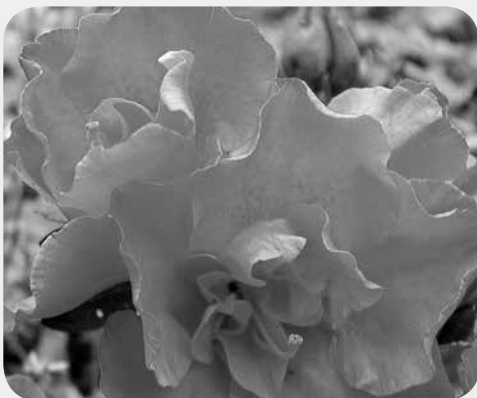
ツツジも種類が豊富

この記事に目を留めていただいた皆さんどうぞ東北の温泉に足を運んで下さい。もしかしたらどこかの温泉場で私に会えるかも・・・話の続きはそこで語らしましょう。