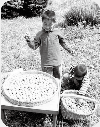
初夏は たわわに実った梅