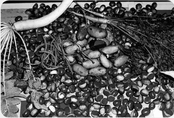
秋は 栗拾いとアケビ取り (1時間程で)