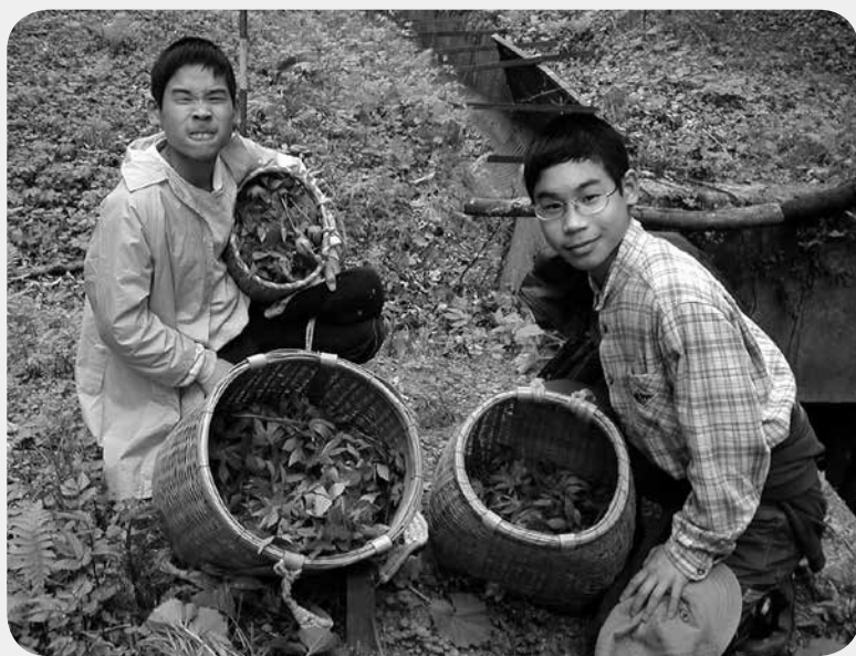
春は山菜 子供らとシドケ取り、1時間程でこの通り（10本で300円の高級食材） 2002.04（11年前）

そこを紹介してくれた人が、「まあ、どんなもんか1年くらい住んでみて野菜を育てたらいいちゃ」と言ってくれたことで月1万円で家も畑地も借りることになった。