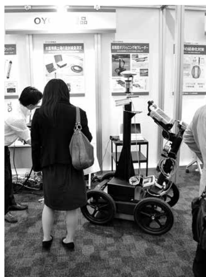
高精度ポジショニング地中レーダー