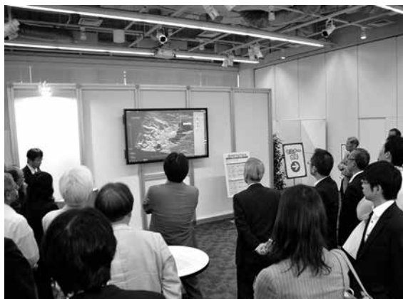
地盤の三次元化システムのデモ風景