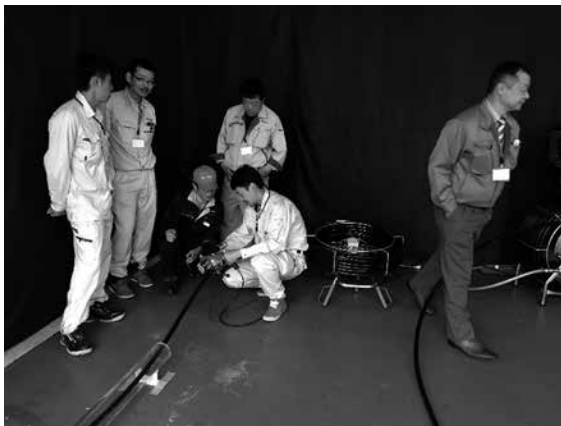
写真-1 デモンストレーションの様子①

IMS Robotics社は穿孔機に特化したドイツのメーカーで、屋内配管用(最小 \phi 70mm)から下水道本管(最大 \phi 600mm)用まで様々な口径に対応できる穿孔機を取り揃えています。この穿孔機の特徴としては、エア駆動式でありながら油圧式にも劣らないトルクを有していること、穿孔から拡径作業まで一貫して行えること、急角度の曲がり管にも対応できることです。また、下水道本管側からと取付管側から穿孔できる両方のシリーズを有していて、これまでの日本では見られない機能という感じがしました。