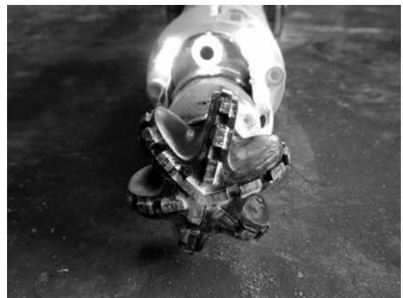
写真-3 透けるカッター刃