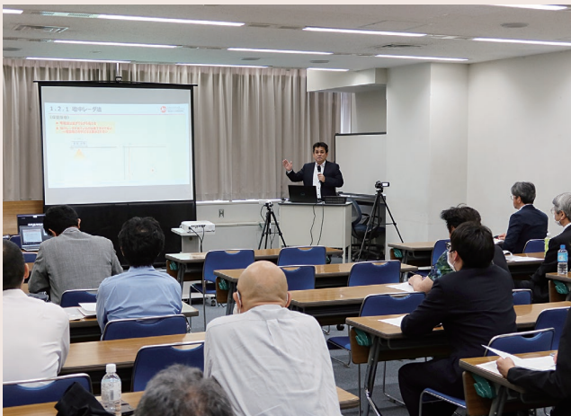
▲ 現地での講習会の様子