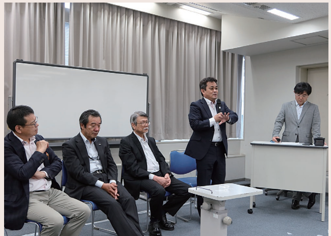
▲ パネルディスカッションの様子